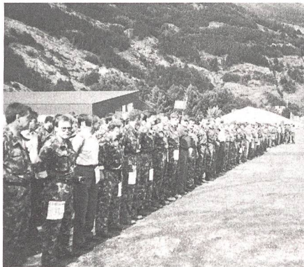
Auf der Oberen Au bei Chur ist das Marschbataillon zum Abmarsch bereit.

Die Hälfte des Detachements des UOV Oberer Zürichsee verschob sich dann, leider vor Ende der Übung, nach Chur an die Obere Au, zum Sammelplatz des Zweitagemarsches. Noch tiefblauer Himmel und wärmender Sonnenschein über Chur, als die Marschfans um 12 Uhr in der Oberen Au eintrafen. Wie schon in früheren Jahren gekleidet in den ver-