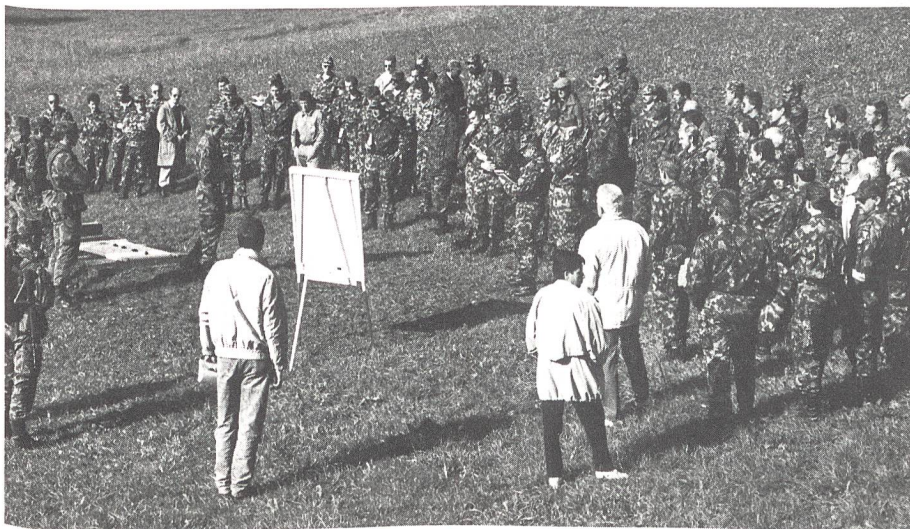
Interessierte Zuhörer bei den Erklärungen zum Pzaw-Team durch den Wettkampfkommendanten der Schweizerischen Unteroffizierstage 1995.