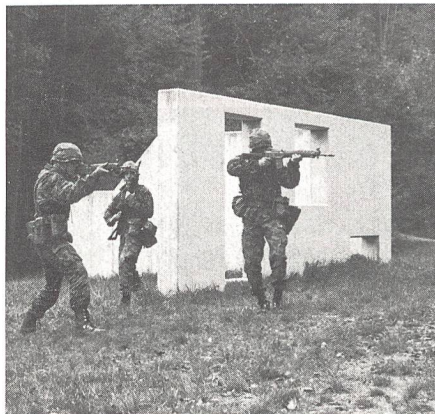
Angehen und ...