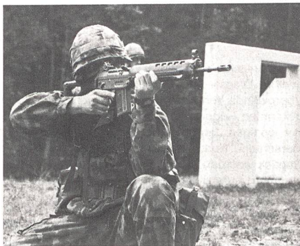
... Sichern einer Fassade im Häuserkampf.

zeugkontrolle demonstrieren die Leute der Inf RS 204 ein harmloses und ein gefährliches Beispiel. Nach der Verschiebung zu den Häuserkämpfanlagen im Oristal sehen die Kursteilnehmer drei Demonstrationen zu den Themen: Angehen und Sichern einer Fassade, Eindringen in ein Gebäude und Beginn der Säuberung und als drittes Fortsetzung der Säuberung. Hptm i Gst Reber verweist darauf, dass für die SUT 95 in dieser Disziplin die Technik mit dem Sturmgewehr geschult werden soll.