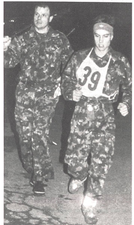
Die tiefen Temperaturen waren wohl angenehm während den einzelnen Laufstrecken ...

Das Wettkampfgebiet, in dem der diesjährige Nachtpatrouillenlauf zur Austragung gelangte, verteilte sich wie in den Jahren zuvor von Wetzwil, Toggwil bis auf den Künsbacher- und den Limberg. Der Nebel ebenfalls. Die tiefen Temperaturen – wenige Grad über dem Gefrierpunkt – waren zwar wohl angenehm während den Laufstrecken, weniger allerdings an