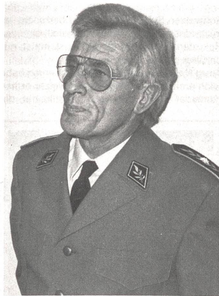
Brigadier Martin Stucki, Direktor der MFS in Wädenswil.

Das Grundstudium sowie das abschliessende Fachstudium beinhaltet einerseits 29 Hochschulsesterwochen an der ETH und zusätzlich 16 Zwischensesterwochen, die im Ausbildungszentrum Au/Wädenswil durchgeführt werden. Das Diplomstudium ist dadurch charakterisiert, dass es einerseits die allgemeinbildenden Fächer angemessen dem Hochschulniveau und andererseits während des Praktikums eine gründliche «Vorortausbildung» – mehrheitlich mit der Truppe – anbietet. Die heutige Ausbildung wird zeitlich um ein Jahr verlängert und inhaltlich den neuen Möglichkeiten, Bedürfnissen und Erkenntnissen so angepasst, dass letztlich das angestrebte Ausbildungsniveau der angehenden Instruktionsoffiziere mindestens mit einer