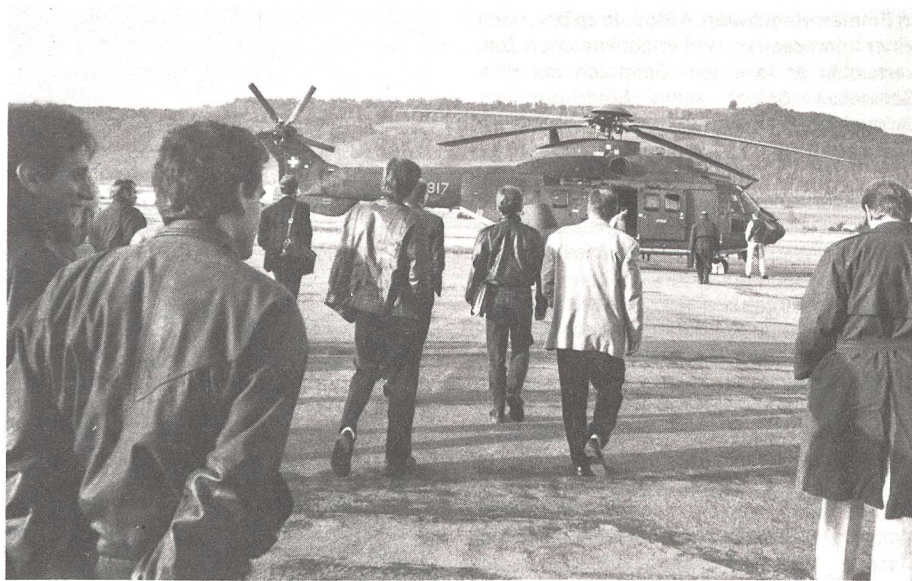
08.15 Flughafen Bern-Belpmoos. Vor dem Start der Super Puma, die uns in 26 Minuten nach Au/Wädenswil brachte.

Der Ausbildungschef möchte den heutigen Medientag besonders der Ausbildung der Instruktionsoffiziere widmen, denn, so Christen, «dem Beruf des Instruktionsoffiziers», dem «Inschterof», wie er bei der Truppe heisst, haften jede Menge Vorurteile und Klischees an. Bei Umfragen über Sozialprestige der ver-