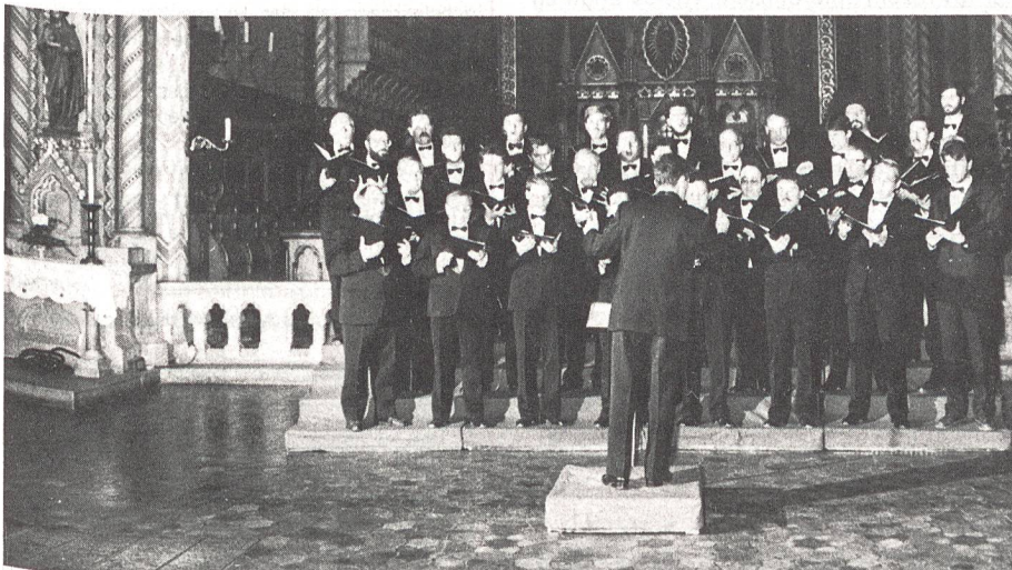
Der Chor der Honvéd (ungarische Armee) in der Matthias-Kirche von Budapest.