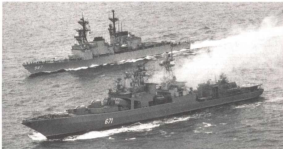
Gemeinsam üben der amerikanische Zerstörer USS O'Bannon (DD-987), hinten, und der russische Raketenzerstörer Admiral Levchenko (vorne) im Nordatlantik vor Severomorsk.