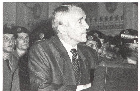
Nationalrat Werner Vetterli

Anschließend beglückwünschte er alle jungen Offiziere zu den in den vergangenen 17 Wochen erbrachten Leistungen. Er unterstrich die Wichtigkeit einer gut funktionierenden Infrastruktur, sind doch alle hier ausgebildeten Offiziere entweder bei den Fliegerübermittlungs-, Fliegerboden- oder Fliegerabwehrtruppen eingeteilt und somit verantwortlich, dass nur so, zusammen mit einer starken Flugwaffe, der sicherheitspolitische Auftrag der Armee ausgeführt werden kann. Mit Bezug auf die im Armeeleitbild 95 festgehaltene « menschenorientierte Führung auf allen Stufen» rief er alle Anwesenden auf, sich für eine starke Armee, mit oder ohne europäische Sicherheitskonzeption, einzusetzen.