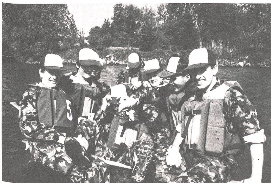
Der UOV Reiat, eine Wettkämpfer-Sektion, die weitherum bekannt und gefürchtet ist (hier anlässlich der Reusstalfahrt 1991).

Wie die zwei Vorstandsvertreter des UOV Reiat feststellen können, wird der Sektion von den Behörden für die verschiedensten Anlässe immer wieder eine