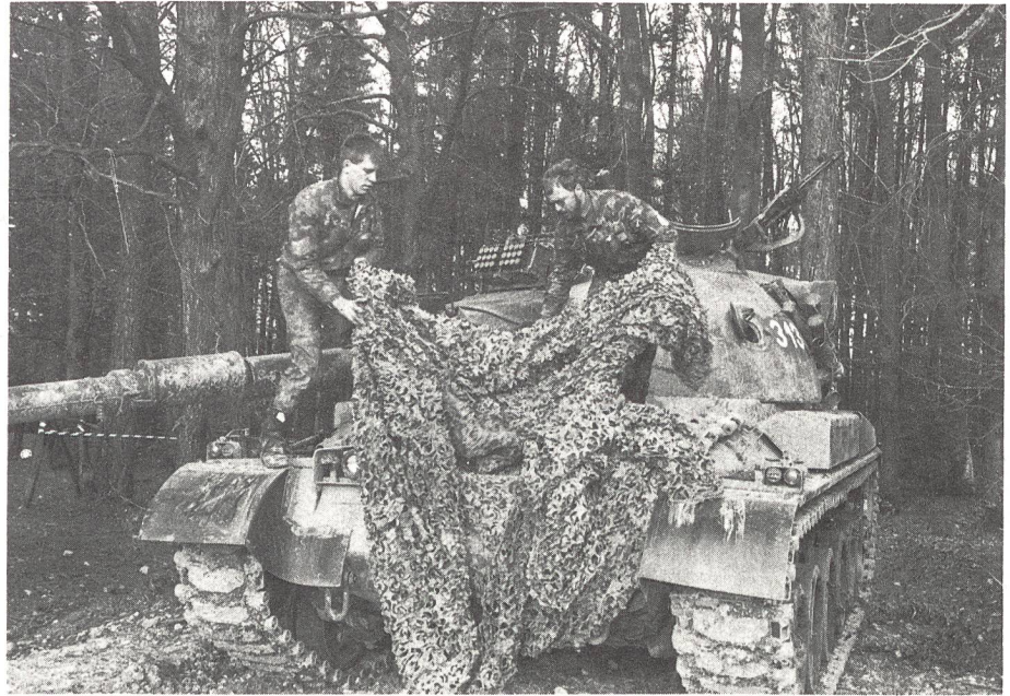
Wm Willi und Pz Sdt Otz beim Enttarnen kurz vor ihrem Einsatz.

Dieses Ziel ist nicht einfach zu erreichen, wenn wir berücksichtigen, dass wir jährlich nur für eine begrenzte Zeit zusammenarbei-