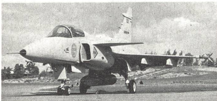
JAS 39 GRIPEN

A. Rollier, a. Oberrichter, Bern Aus Medien-Panoptikum R Burger, 5736 Burg