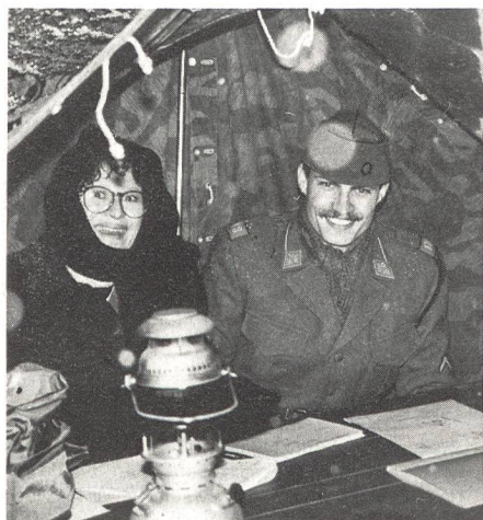
Viele Helferinnen und Helfer sorgten bei winterlichem Wetter für das Gelingen des Nachtpatrouillenlaufes.

Der UOV Schaffhausen könnte einen solchen Grossanlass nicht durchführen, wenn er nicht von weiteren militärischen Vereinen unterstützt würde. Tatkräftige