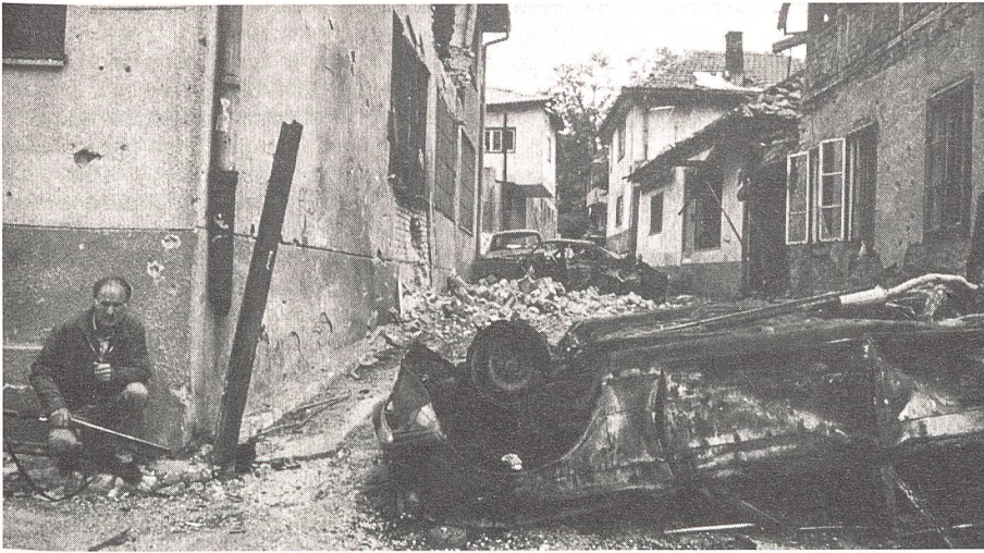
«Aus der Geschichte nichts gelernt – Sommer 92 Sarajewo – bald jeder noch Zurückgebliebene ist bewaffnet.» Quelle: NZZ-FOLIO Sept 92

trationslagern exemplarisch aufzeigt. Die Möglichkeiten zur Einmischung von Drittstaaten mit entsprechender Ausweitung der Konflikte sind heute wieder unendlich vielfältiger als zur Zeit des kalten Krieges. Lokale Machthaber in den ehemals sowjetischen Republiken stützen sich häufig einzig auf die Macht der Bajonette, welche sie kommandieren. Man nannte diese Sorte von Machthabern im Alten China « War Lords », in Südamerika « Commandantes ». Sie bescherten ihren Untertanen kaum mehr als Blut und Tränen.