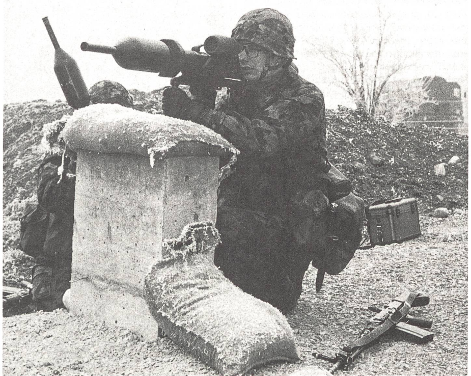
Panzerfaustschütze in einer schulmässigen Feuerstellung mit dem Panzerfaust-Einsatzlaufgerät.

Beim Inf Rgt 32 aber handelt es sich ohnehin um einen Ausbildungsverband, in welchem die drei Auszugsbataillone 61, 75 und 78 zu-