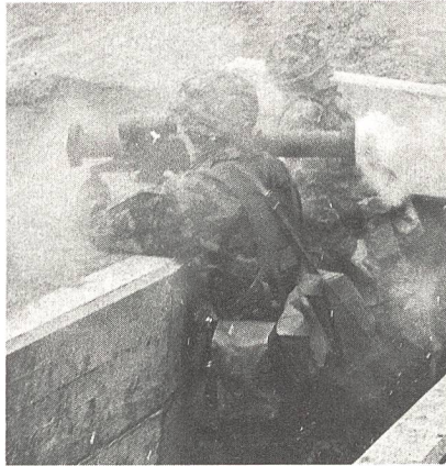
Panzerfaust-Schützentrupp nach dem Abfeuern der Panzerfaust-Hohlladungspatrone.

Die Panzerfaust ist eine tragbare, ab Schulter frei oder aufgestützt geschossene Einmann-Panzerabwehrwaffe. Sie ersetzt bei der Infanterie das Raketenrohr. Das System besteht aus dem wiederverwendbaren Abschussgerät und der Hohl-