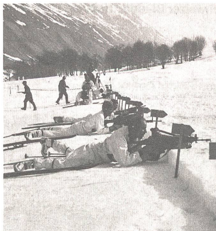
Stimmungsbild vom Schiessplatz.

Bei Annahme der Initiative durch Volk und Stände könnten bis zum 31. Dezember 1999 keine neuen Kampfflugzeuge beschafft werden. Ein Ja zu dieser Initiative hätte zur Folge, dass wir die nächsten 10 bis 15 Jahre gegenüber Bedrohungen aus der Luft praktisch wehrlos wären. Die Chancen unserer Erdtruppen, in einem modernen Konflikt bestehen zu können, würden dadurch praktisch aussichtslos. Die bei einer Annahme der Initiative zur Disposition stehenden 3,5 Milliarden Franken würden im Rahmen des ordentlichen EMD-Budgets für andere Beschaffungsvorhaben verwendet und kämen nicht, wie von gewissen Kreisen suggeriert wird, Rentnern und Hilfsbedürftigen oder dem Gesundheits- oder Bildungswesen zugute. Die Beschaffung eines neuen Kampfflugzeugs bewirkt keine zusätzliche Belastung der Bundeskasse und hat auch keine Steuererhöhung zur Folge. Genauso wenig führt eine Nichtbeschaffung zu einer Steuersenkung.