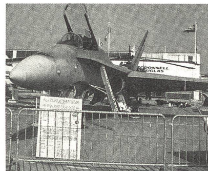
McDonnell Douglas F/A-18 A/C/D Hornet (bordgestütztes Mehrzweckkampfflugzeug, Mach 1.8 + auf 12 150 Meter Höhe, 20-mm-Revolverkanone, 7711 kg Aussenlasten, US Navy, US Marine Corps, Kanada) (auf dem Bild CF-18 Kanada).

Im Buch wird für den Fall Schweiz weniger von Bedrohungen gesprochen als mögliche zukünftige Entwicklungen anhand von Szenarien auf-