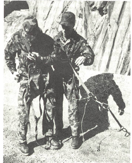
In der «Schöllenen» wurde das Anseilen eines Retters mit einem Verletzten vordemonstriert, was sich in der Höhe des Felsens tatsächlich abspielt.

an steilen Felswänden. Hier muss bedächtig und überlegt gehandelt werden. Ein falscher Griff an den Rettungsseilen kann sich für den Verunfallten wie aber auch für seinen Retter verhängnisvoll auswirken.