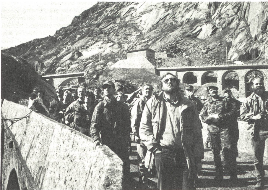
Die Medienvertreter erleben mit Spannung die Rettung eines Verletzten hoch oben im Felsen.

Wie sich das Zusammenspiel zwischen militärischen Helfern und zivilen Rettern auswirkt,