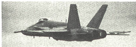
F/A-18 HORNET – ab 1996 fliegt dieser Typ neu auch bei der Schweizer Luftwaffe.

Flugzeugerkennersich kann die « Hornisse » ein harter Brocken sein. Die Maschine ähnelt von der Ausle-