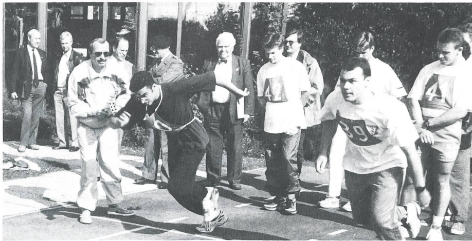
Prüfung der körperlichen Leistungsfähigkeit (80 m Schnelllauf)