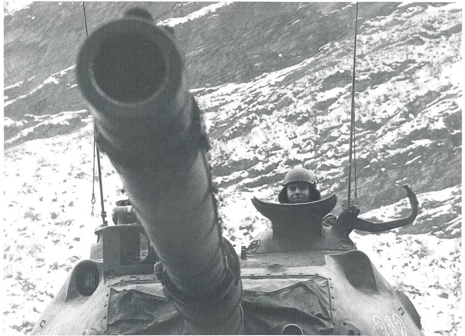
Der Kampfwert des Panzers 68 hat sich mit dem Einbau der Feuerleitanlage 88 wesentlich erhöht.

Der wesentlichste Unterschied zu den bisher