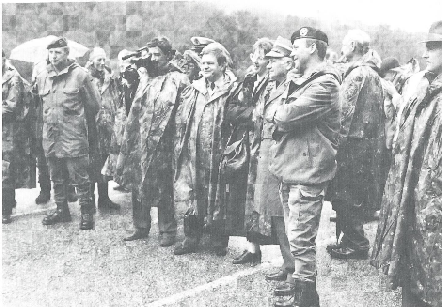
Aufmerksame Beobachter der Grenadiervorfürungen in Isone. Dritter von rechts mit verschränkten Armen der EMPA-Generalsekretär Oberstlt Wilhelm Bocklet (BRD).

Am Treffen in Lugano beteiligten sich Vertreter von Bulgarien, Deutschland, Italien, Nie-