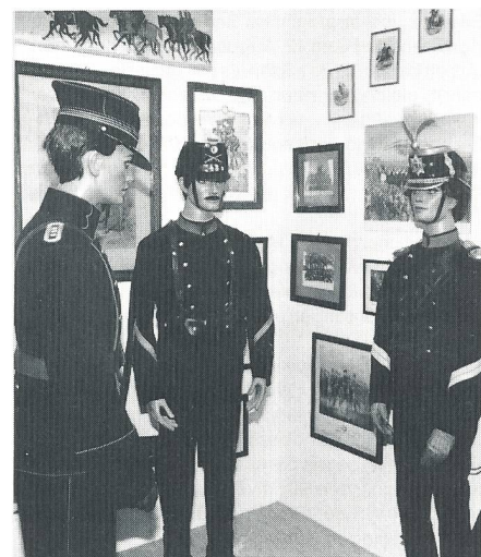
Landwehr-Offiziere aus dem 1. Weltkrieg: ein Genie Hptm, ein Füsiliere Kpl und ein Guide (Meldereiter) mit Federbusch auf dem Helm.