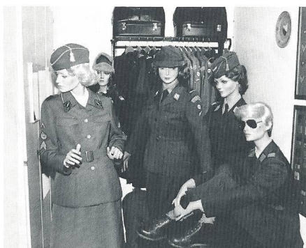
Frauen in der Schweizer Armee: Rotkreuzdienst – FHD – MFD.