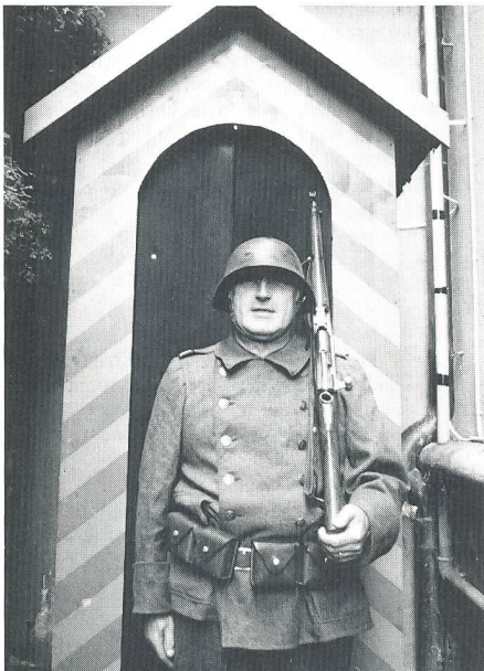
Durch dieses Wachthäuschen erreicht man das Museum.