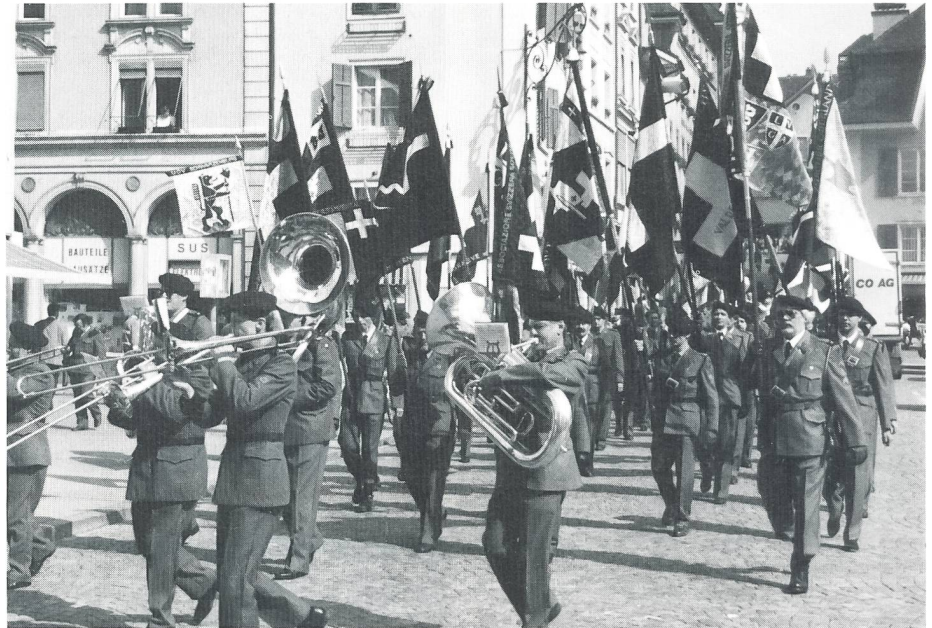
Aufmarsch der Delegierten zur Versammlung in Solothurn.

Alter von 64 Jahren starb. Er gehörte dem Zentralvorstand während 15 Jahren bis 1983 an und amtierte fünf Jahre als Vizezentralpräsident.