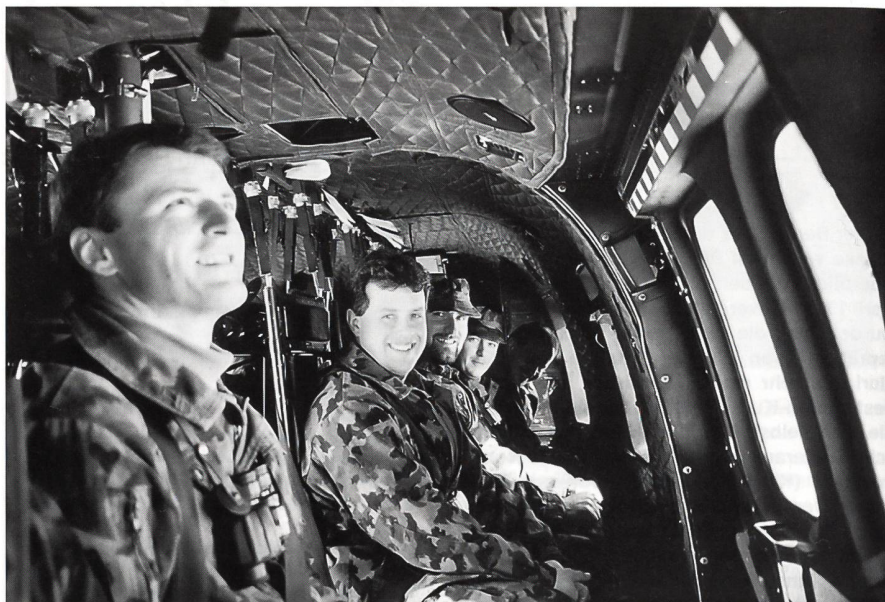
Rekognoszierungsflug zur Grundlagenbeschaffung einer Lagebeurteilung.

Dass die Wechselwirkung zwischen militärischer und ziviler Führung in einem militärischen Führungslehrgang ein Thema ist, ist selbstverständlich. Die Erkenntnis, dass der Führungsrhythmus, aber auch die Lagebeur-