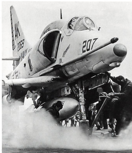
Das «Arbeitspferd» der US Navy im Luftkrieg gegen Nordvietnam war der Jagdbomber «Skyhawk» . Viele Piloten, die diese Maschine flogen, gerieten in Gefangenschaft. Das Foto zeigt eine Maschine der Angriffsstaffel VA-106 bereit zum Katapultstart vom Flugzeugträger «USS Intrepid» im September 1968 im Golf von Tonkin.

Die günstigen Bedingungen im Golfkrieg existierten 1964 bis 1973 nicht. Hunderte von Piloten und Besatzungsmitgliedern verloren ihr Leben oder gerieten in Gefangenschaft, weil sie unter nicht optimalen Bedingungen ihre Einsätze fliegen mussten. Noch werden nach unterschiedlichen Quellen über 2000 Amerikaner vermisst, deren Schicksal weitgehend ungewiss ist. Man nimmt an, weiss es hingegen nicht genau, dass etwa 1040 davon im Kampf gefallen sind ( «Killed in action» oder KIA). Nach offiziellen nordvietnamesischen Angaben gerieten 1205 Amerikaner in Gefangenschaft, nämlich etwa 624 Flieger in Nordvietnam, 143 Flieger in Südvietnam (in die Hände des Vietkong), und rund 438 andere Armeeeingehörende in Nord- und Südvietnam, in Laos und Kambodscha. Der US-Nachrichtendienst CIA glaubt allerdings, dass diese Angaben um etwa 500 zu tief angegeben worden sind. Noch heute zirkulieren hie und da Meldungen in der amerikanischen Presse, wonach immer noch Amerikaner in Nordviet-