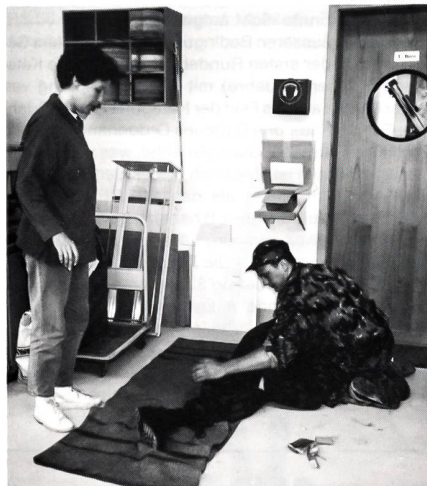
Der Posten Kameradenhilfe am JUPAL, inspiziert von der Samariterlehrerin.

Folgende Disziplinen waren zu absolvieren: Sturmgewehrschiessen, Geländepunkte bestimmen, Distanzen schätzen, Raketenrohrschüssen, HG-Werfen, Kameradenhilfe/AC-Schutzdienst, militärisches Wissen, Panzer- und Fliegererkennung, Übersetzen mit dem Schlauchboot über die Aare und Skore-Orientierungslauf.