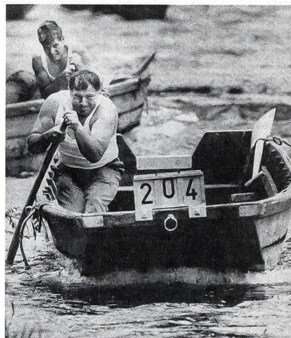
Zwei von tausend Pontonieren in kraftvoller Aktion

Am Wochenende 23. bis 25. Juni kämpften bei recht schwierigen Bedingungen über 1000 Pontoniere aus 40 Sektionen der ganzen Schweiz in der Limmat rund um die Werdinsel mit Stachel und Ruder um Kränze