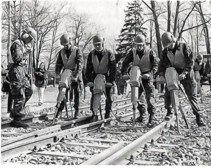
Die grosse Schau der Militäreisenbahnsappeure.

Eindeutig «den Vogel abgeschossen» hat die Eisenbahnsappeurkompanie, die ihr Trainingsgelände beim Bahnhof Effingen hat. Was diese Spezialisten am Ende der neunten RS-Woche boten, war schlicht Spitze: Sie bauten auf dem Holzplatz im Brugger Schachen eine ganze Gleisanlage (zum Teil inklusive Schotterbett) auf – mit Stromabnehmer, mit Verzweigung usw. Und das mit einer fortgeschrittenen Selbstsicherheit, die erstaunte und gleichzeitig zeigte, dass diese jungen Wehrmänner begriffen haben, um was es bei ihrer militärischen Ausbildung geht. Ein uneingeschränktes Kompliment gebührt schliesslich aber der ganzen, unter dem Kommando von Oberst i GSt Hansjörg Brugger stehenden Genie-RS 56/95 und vorab den Ausbildern. Da wird beste Arbeit geleistet!