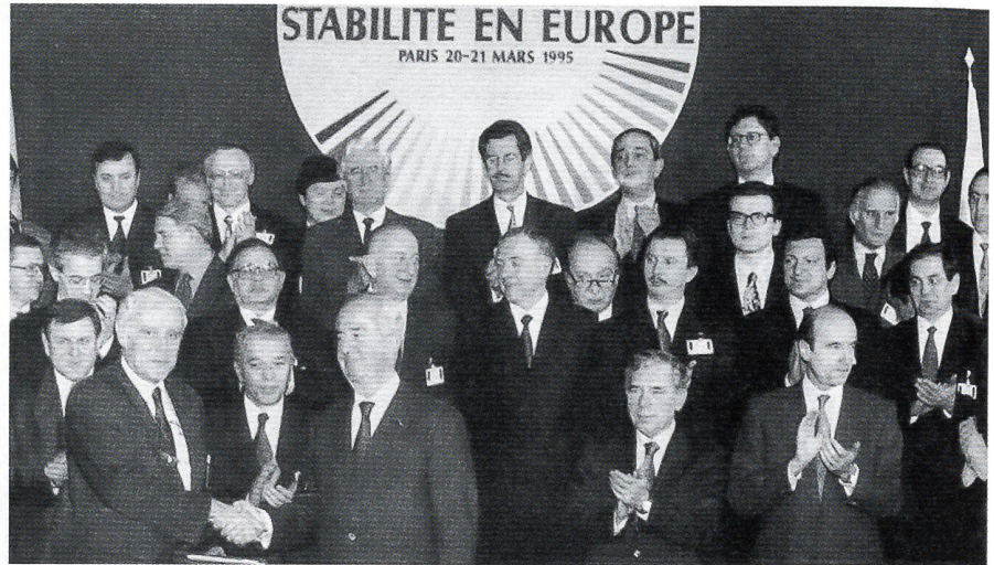
Der französische Premierminister Edouard Balladur (dritter von links, vorderste Reihe) nimmt am 20. März 1995 in Paris während der Konferenz über den Stabilitätspakt für Europa die Glückwünsche des OSZE-Vertreters Flavio Cotti entgegen. Bild «NATO Brief» Juni 95

Die Westeuropäische Union (WEU) soll nach dem Vertrag von Maastricht zum verteidigungspolitischen Bestandteil der EU ausgebaut werden und den europäischen Pfeiler der NATO bilden. Die WEU hat den sechs mittelosteuropäischen Ländern und den drei baltischen Staaten das Statut einer assoziierten Partnerschaft angeboten. Sie baut ihre operationellen Fähigkeiten im Bereich Krisenbewältigung aus.