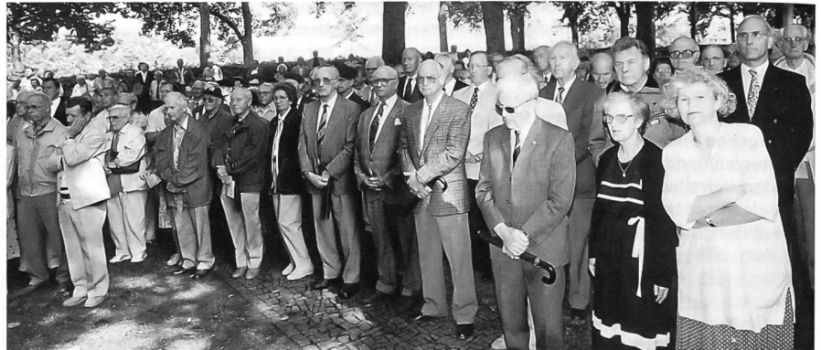
Die Teilnehmer gedenken ihrer verstorbenen Kameraden.