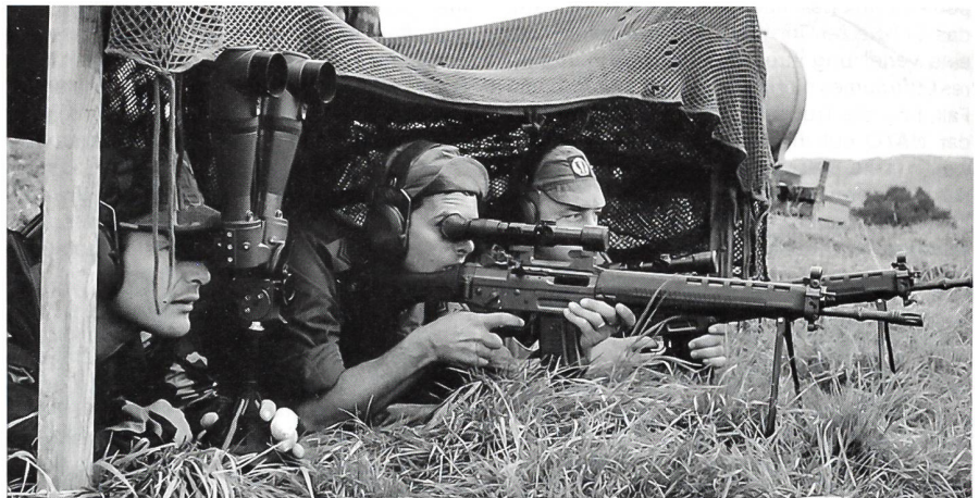
Scharfschiessen mit aufmontiertem ZF auf dem Sturmgewehr 90.

In einem auf rund 11 km führenden Parcours mit Start beim Fussballplatz Bruggfeld führte die diesjährige Routenwahl der Thur entlang zum Unterghögg, wo es Flugzeugerkennung als erste Postenaufgabe zu lösen gab. Beim Hauserfelsen Richtung Golfplatz Niederbüren galt es innerhalb einer Minute mit dem Schlauchboot die Thur zu überqueren, auf den ersten Blick keine schwierige Aufgabe. Doch das fließende Gewässer, nach einem Gewitterregen in der Nacht zuvor doch überdurchschnittlich schnell, machte Patrouillen arg zu schaffen. Zahlreiche Patrouillen landeten auf der Gegenseite meist nur mit einer oder mehreren Pirouetten. Oberhalb der Kobessenmühle erreichten die Patrouillen Posten 3 mit Pistolenschüssen. Premiere gab es beim Posten 4 mit Scharfschiessen, mit dem Zielfernrohr aufmontierten Sturmgewehr 90. Ein sehr guter Posten