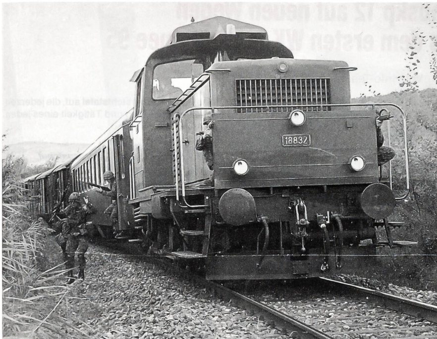
Blitzartig reagieren die Grenadiere beim Anhalten des «Übungszuges» in Etwilen.

Bahnbetrieb wichtig? Sind es die Stellwerke? Sind es die Trafostationen (ohne Strom fährt kein Zug)? Sind es Strassenüberführungen? Ist es zum Teil auch das Zwischengelände? Aus diesen Absprachen ergab sich die Zahl von 18 Aufträgen.