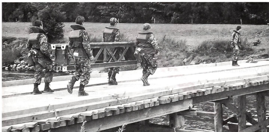
Bei Amlikon: Brückenbau ist harte Arbeit.

Auf dem Bahnhof Etzwilen orientierte der Kdt Füs Bat 68 über seinen Auftrag: Bewachen/Überwachen und Sichern von stationären Objekten von Etzwilen bis Ossingen exklusive, insgesamt deren 18. Eine Kp habe er in Etzwilen eingesetzt, eine im Zwischengelände bis Stammheim, eine in Stammheim selbst und eine im Zwischengelände bis Ossingen. In der Rekognoszierungsphase sei der Verbindungsaufnahme mit den Stationsvorständen grosse Bedeutung zugekommen zur Abklärung folgender Fragen: Was ist für den