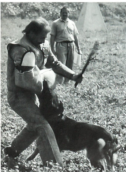
Der Schutzhund weicht der Gefahr nicht aus, sondern springt den «Verdächtigen» an.

an dem zur Eröffnung des HAZ durchgeführten Wettkampf teilzunehmen. Ausgetragen wurden die Disziplinen « Unterordnung » und « Schutzdienst ». Hinzu käme nach internationaler Wettkampfprüfungsordnung noch die Fährtenarbeit, welche aber an diesem Anlass nicht geprüft wurde. Die Gästeschar staunte nicht schlecht, als die Hundeführer mit ihren Hunden vor die Aufgabe gestellt wurden, einen versteckten Täter aufzustöbern und nach dessen Auffinden zu verbellen. Konsequenterweise wurde der Hund entsprechend den Anweisungen seines Führers einen versteckten « Täter » und stellte sich dermassen bellend vor dem Figuranten auf, dass dieser nicht den Hauch einer Chance hatte, um zu entfliehen. Gleich ging es denjenigen « Verdächtigen », die auf ein klares und bestimmtes « Halt, Militär! » nicht reagierten. Unverzüglich schickten die Hundeführer ihre Hunde los, um die Entwichenen aufzuhalten und anzufallen. Zum Glück tragen diese dick gepolsterte Kleidung. Ebenso schnell lassen die Hunde aber vom « Täter » ab, wenn es der Führer von ihnen fordert. Erstaunlich dabei war aber, dass die Hunde von den « Verdächtigen » auch dann nicht lassen, wenn diese den Hunden mit einem Stock recht ordentliche Schläge aus teilen.