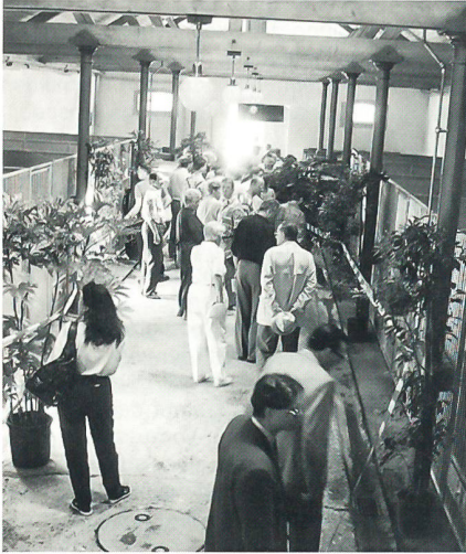
Blick in die grosszügigen und praktischen Zwingeranlagen des neuen HAZ EMD.