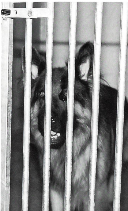
Er profitiert als einer der ersten «Bewohner» der HAZ EMD von den tierfreundlichen Einrichtungen.

Die rund 36 Lawinenhunde sind in der Armeelawinenabteilung der Flieger- und Fliegerabwehrtruppen eingeteilt. Hund und Führer werden in diesem Falle nach den Richtlinien des Schweizerischen Alpenclubs ausgebildet.