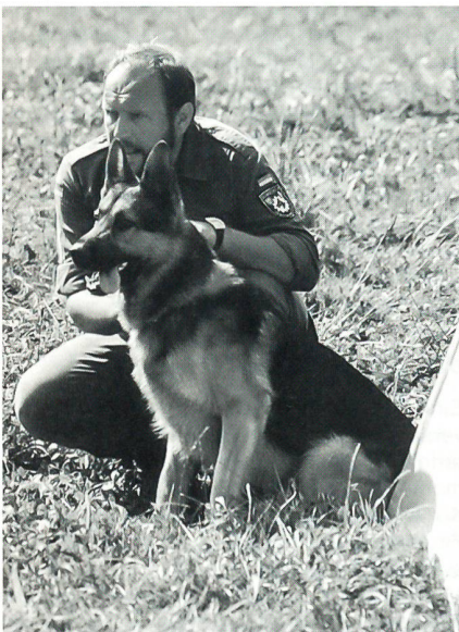
Ein Team der Deutschen Bundeswehr beim Beobachten des Geländes.