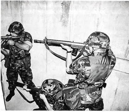
Im engen Treppenhaus sind Massierungen unvermeidlich.

Reber kurz theoretisch in die Häuserkampftechnik eingeführt. Nach einem ausführlichen Aufwärmtraining wurden zuerst einige verschiedene Einstiegs-techniken geübt: Sprung, Balken-Lift, Hühnerleiter und Drei-Mann-Pyramide. Das wichtigste Kriterium beim Einstieg ist, dass das Stgw stets schussbereit ist. Im weiteren wurde uns die spezielle Kommando-sprache beigebracht, die jedes Mitglied des 3er-Trupps beherrschen muss, damit die nachfolgenden Gruppenmitglieder jederzeit informiert sind. In dieser Situation muss auch jedes Mitglied der Gruppe in der Lage sein, einen 3er-Trupp zu führen.