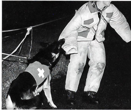
Wenn der Schäferhund zubeisst, gibt es kein Entrinnen mehr.

Die Mitglieder der Unteroffiziersvereine hatten nun die Aufgabe, unter Einbezug der Natur die Hunde und ihre Führer zu überlisten und das Objekt in zwei Phasen anzugreifen. In drei Gruppen machten sie sich auf den Weg, um in der Nacht das Gelände und das Objekt zu erkunden. Zwei der drei Gruppen waren erfolgreich und konnten an der anschliessenden taktischen Sitzung ein strategisches Vorgehen planen. Die andere Gruppe wurde kurz vor dem Ziel von der Hundeführergruppe erkannt und überwältigt. In einer zweiten Phase wurden die Helfer mit Spezialkleidern ausgestattet, damit die Hunde ihr Können beim Beissen unter Beweis stellen konnten. Ein