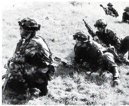
Gefechtsgruppe der Infanterie mit Laserdetektoren am Helm, welche auf Laserstrahlen reagieren, die von gegenseitigen Füsiliern mit dem Sturmgewehr 90 gezielt ausgelöst werden.

Im Rahmen eines Presseanlasses am 19. Sept des Feldarmeekorps 4 auf dem Truppenübungsplatz Bernhardzell bei St. Gallen war Gelegenheit geboten, sich ein Bild darüber zu machen, wie die Ausbildungseffizienz gesteigert werden soll. Zuteilung fester, «fertig» eingerichteter Ausbildungsplätze und Nutzung der Simulatortechnik lautet das Rezept, mit dem eine Verbesserung angestrebt wird. Spätestens Anfang 1997 sollen alle vier Armeekorps über eine