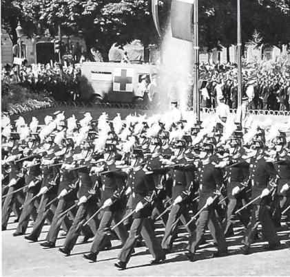
156 Offiziere der «Ecole Spéciale Militaire de Saint-Cyr» in der passenden Paradeuniform mit den Farben: Bleu, Blanc et Rouge.

Über 8000 Polizeibeamte standen an diesem Nationalfeiertag im Einsatz und sorgten für Ruhe und Ordnung.