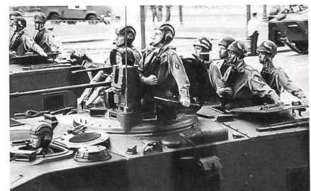
Speziell an den Handstellungen der Soldaten des 35. Panzer-Infanterieregimentes kann man erkennen, dass diese Besatzungen wissen, wie man eine richtige Parade zu absolvieren hat.