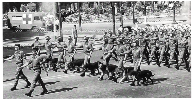
Angehörige des UIISC 1 mit ihren Diensthunden. UIISC 1 steht für: L'Unité d'Instruction et d'Intervention de la Sécurité Civile N° 1 . Diese Truppe rekrutiert sich aus Armeeangehörigen der Genie-Einheiten und ist dem Innenminister unterstellt.

Das Kavallerieregiment der Garde Républicaine ist ein Teil der GENDARMERIE NATIONAL und ist speziell für die Sicherheit des französischen Staatspräsidenten und die Ehrenwache am Elysée-Palast abkommandiert. Der effektive Bestand dieses berittenen Regiments umfasst 14 Offiziere, 502 Unteroffiziere und 64 Gendarmen sowie 515 Pferde.