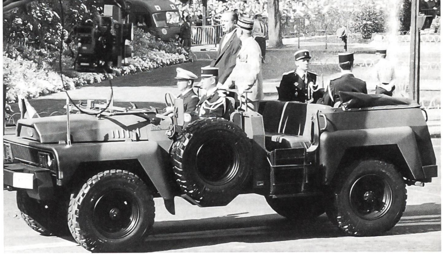
Der Präsident der République Française JACQUES CHIRAC mit dem Chef des Armeestabes und Militärgouverneur von Paris, Général d'Armée GUIGNON. Das Fahrzeug ist ein VLRA (Véhicule de Transport Multifonction, Dieselmotor 125 PS).

Die am 1. Mai 1803 gegründete Schule wurde am 22. April 1914 mit einer der höchsten Auszeichnungen Frankreichs dekoriert, und zwar mit der Légion d'Honneur . (Auf den Schlachtfeldern des Ersten Weltkrieges fielen über 5000 Saint-Cyriens).