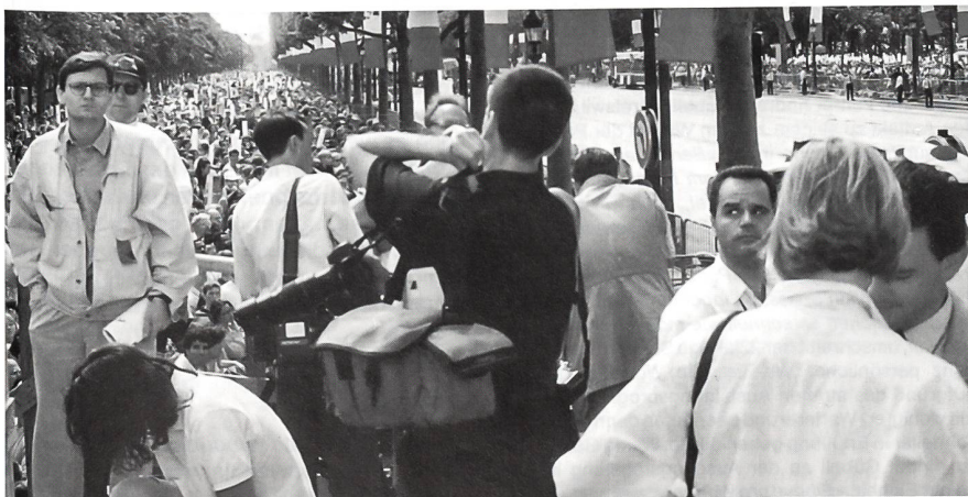
Sicht von der Pressebühne in die Menschenmassen.

Angehörige des UIISC 1 mit ihren Diensthunden. UIISC 1 steht für: L'Unité d'Instruction et d'Intervention de la Sécurité Civile N° 1 . Diese Truppe rekrutiert sich aus Armeeangehörigen der Genie-Einheiten und ist dem Innenminister unterstellt.