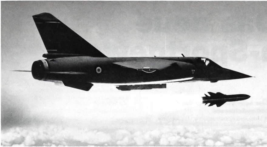
Abschuss des Antiradar-Flugkörpers ARMAT vom Kampfflugzeug MIRAGE F1 aus.