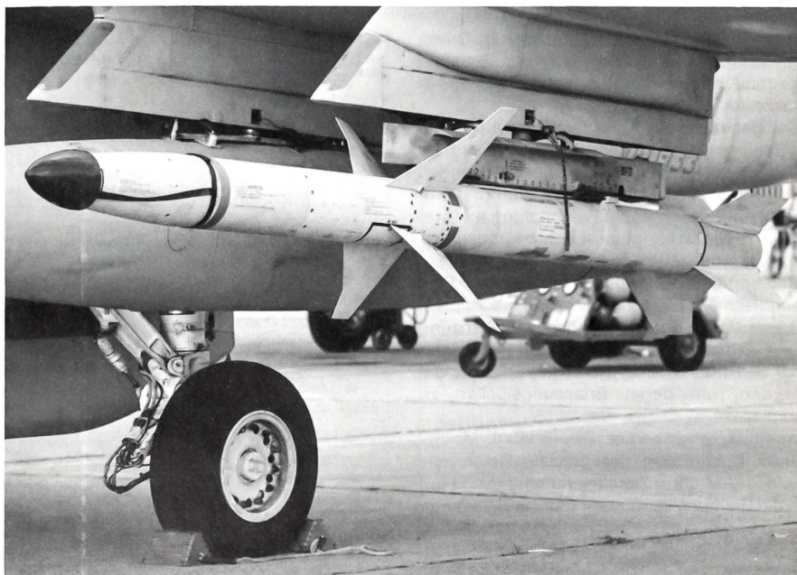
Radarbekämpfungs-Flugkörper AGM-88A HARM.

Da weder SHRIKE noch STANDARD ARM den Anforderungen entsprachen, begann das Naval Weapons Center 1972 mit Studien für eine High Speed Anti Radiation Missile (HARM). Man wollte damit, unter Einbeziehung bisheriger Erfahrungen, vor allem den Suchkopf, die Geschwindigkeit, die Reichweite und die Reaktionszeit verbessern. Zudem sollte neueste Mikroelektronik verwendet