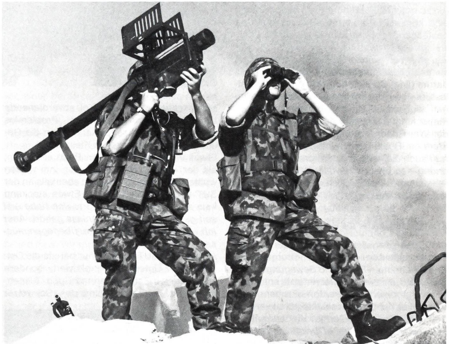
Bekannt aus dem Afghanistankonflikt: Die leichte Flakenlenkwaffe «Stinger»

stationär, zum Beispiel auf Flughäfen genutzt. Auf Schiffe montiert wurde er auch im Falklandkrieg eingesetzt. Mit der Umsetzung der Armee 95 werden die