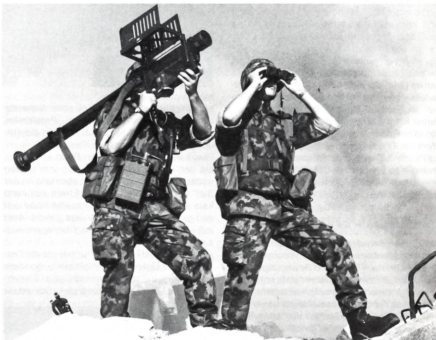
Bekannt aus dem Afghanistankonflikt: Die leichte Flaklenkwaffe «Stinger»

stationär, zum Beispiel auf Flughäfen genutzt. Auf Schiffe montiert wurde er auch im Falklandkrieg eingesetzt. Mit der Umsetzung der Armee 95 werden die