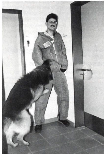
Der Täter ist gestellt, es gibt kein Entrinnen mehr. Der Hund hat sich am Arm festgebissen.