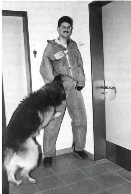
Der Täter ist gestellt, es gibt kein Entrinnen mehr. Der Hund hat sich am Arm festgebissen.