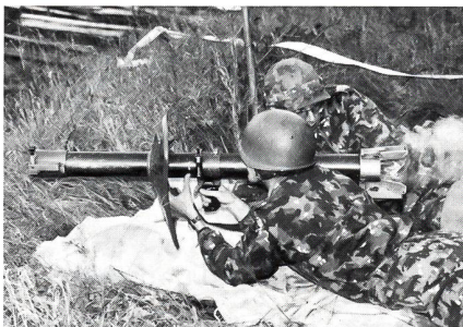
Ein SUT-95-Panzerabwehr-Team in Aktion.