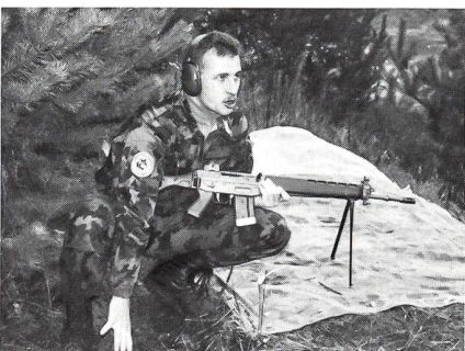
Die 4-Punkte-Kontrolle beim Einsatz des Sturmgewehrs ist wichtig.

und Fritz Burkhalter formulierte im Hinblick auf die SUT 95 für den KUOV Zürich-Schaffhausen ein konkretes Ziel: Drei Sektionen in den Spitzenrängen!