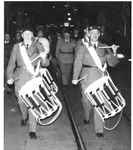
«Basels grüne Fasnacht» – «Glaibasels Baizebummel».

Traditionsgemäss findet die Entlassungsfeier in Kleinbasel statt. In der Halle 301 der Basler Mustermesse (MUBA) ist bereits der rote Teppich ausgerollt, das Rednerpult wird von der baselstädtischen sowie der Schweizer Fahne flankiert, das Militärspiel Basel-Stadt nimmt Aufstellung und die Angehörigen des Feldweibelverbandes beider Basel nehmen die zur