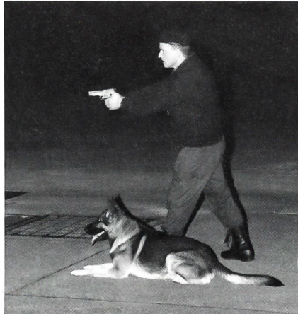
«Halt – stehen bleiben!» Der Hund beobachtet aufmerksam.

In Zusammenarbeit mit der Hundeführergruppe des BAMF (Betrieb Emmen) wurde ein interessanter Informationsabend, verbunden mit praktischen Übungen der Such- und Wachhunde organisiert. Neun Hundeführer beziehungsweise Betriebswächter mit ihren Schutzhunden sind auf dem Flugplatz Emmen angestellt und bemühen sich, während 24 Stunden für Recht und Ordnung zu sorgen. Der Informationsabend wurde in vier Themengebiete unterteilt. Auf eindrückliche Art wurde den Teilnehmern gezeigt, dass es sich bei diesen Tieren nicht um «Kampfbestien», sondern, wenn sie nicht gerade dienstlich un-