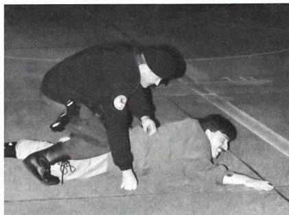
Der Einbrecher liegt flach und wird vom Hundeführer nach Waffen untersucht.

terwegs sind, um ganz normale Familienhunde handelt.