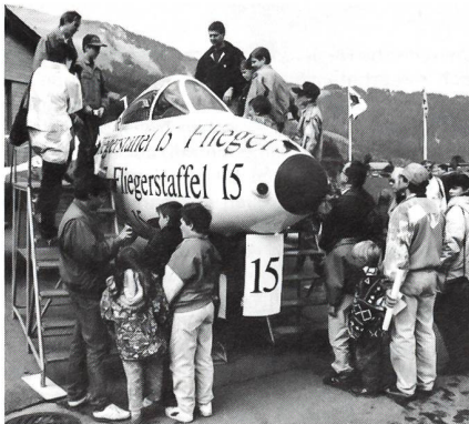
Das Interesse am «Papyrus-Hunter» war am 8. Oktober 1994 sehr gross.

Die legendären Hunter-Flugzeuge der Schweizer Flugwaffe wurden bekanntlich nach 36 Dienstjahren Ende 1994 ausgemustert. Die meisten Hunter werden verschrottet, nur wenige werden in Museen landen und erhalten bleiben. Anlässlich des letzten Hunter-WKs der Fliegerstaffel 15 im November 1993 auf dem Flugplatz St. Stephan wurde von den Staffellangehörigen, insbesondere durch Staffellokommandant Ueli Leutert, die Initiative ergriffen, für diesen Abschied einen speziellen Hunter, im Staffel-Look zu bemalen (siehe Bericht «Schweizer Soldat», Mai 1994). Bald kam die Idee auf, diesen einmaligen und schönen Hunter nicht zu verschrotten, sondern zu erhalten und in St. Stephan zu belassen.