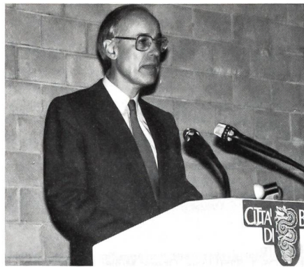
Regierungspräsident des Kantons Tessin, Renzo Respini.

Am 21. Oktober 1994 war es endlich soweit. Nach 17 entbehrungsreichen Ausbildungswochen wurden die 77 Absolventen der Übermittlungs- und Feldtelegrafenschule Bülach in Bellinzona zu Leutnants befördert. Die eindrückliche Feier wurde mit teils hochstehenden Vorträgen des Spiels des Geb Inf