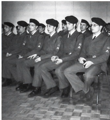
Zufrieden, den technischen Lehrgang mit Erfolg abgeschlossen zu haben.

«Sie haben hier das theoretische Rüstzeug erhalten, um dann im praktischen Dienst ihr Wissen in Taten umzusetzen. Bei ihrem Verband werden sie als Werkstattchef oder Systemspezialist erwartet und können dort das Gelernte mit Erfahrungen ergänzen und vertiefen. Selbstverwirklichung und Selbstüberwindung werden ihren Weg in die Zukunft begleiten. Als Chef werden sie besonders gefordert sein, Ihre Vor-