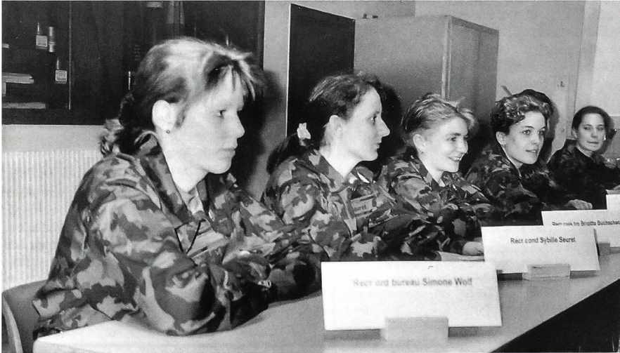
Am Podiumsgespräch nahmen u.a. auch Uof und Rekr (Frauen) der Trsp RS 68 aus Wangen an der Aare teil und äusserten sich frei zur Frage «Warum mache ich eine RS, und wie ist die Zusammenarbeit mit den Männern».