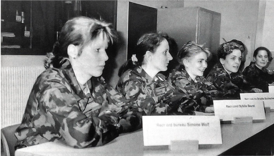
Am Podiumsgespräch nahmen u.a. auch Uof und Rekr (Frauen) der Trsp RS 68 aus Wangen an der Aare teil und äusserten sich frei zur Frage «Warum mache ich eine RS, und wie ist die Zusammenarbeit mit den Männern».