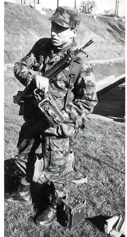
Ein Unteroffiziersschüler erklärt seinen Kameraden das Funkgerät SE 227, so wie er es später den Rekruten vorzeigen wird.

rung eine Spur Realismus bewahrt. Denn ich weiss, dass wir die Kinderkrankheiten unserer «Ausbildung 95» überwinden und dass wir hierfür über die nötigen personellen und finanziellen Mittel verfügen werden.»