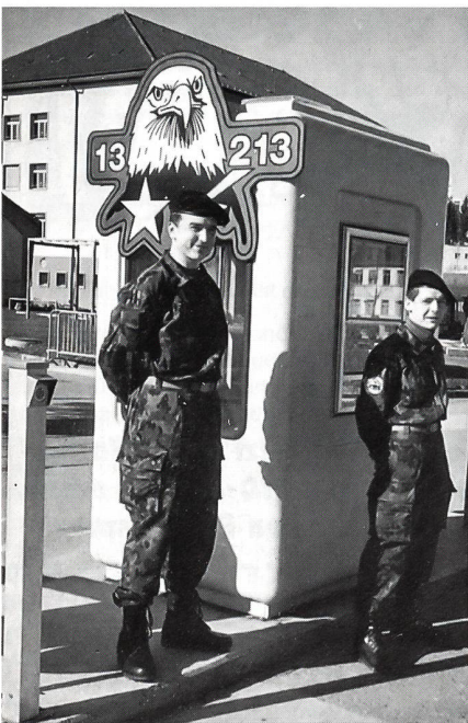
Der Plantondienst vor der Kaserne «La Poya» muss gelernt sein.

Hiezu Christen : «In der vierten Woche der Rekrutenschule stossen die Korporale auf eine eingespielte Organisation eines Zuges, der schon im «Klassenverband» gearbeitet hat. So kommt es zweifellos zum Schock des 4. Montags ».