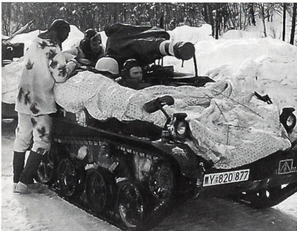
Kleinpanzer WIESEL mit TOW und MG (12,7 mm) vom deutschen Luftlandebataillon 262.