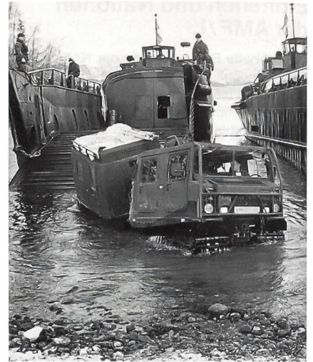
Ein niederländischer HÄGGLUNDS BV 206 beim Verlassen eines Landungsbootes.

Der Heimathafen befindet sich in Norfolk, Virginia. Das 1971 in Dienst gestellte Schiff ist ausgerüstet mit zwei Bordkanonen (25 mm), sechs Maschinengewehren (Kaliber 50) sowie einem anti-ship and missile defense system (CIWS) [20 mm]. Mannschaft: 1469 Personen Ladefähigkeit: 17 000 Tonnen Länge und Breite: 620 feet (188,97 m); 108 feet (32,92 m) Tiefgang: 25 feet (7,62 m) Fassungsvermögen für Verpflegung: 90 Tage Platz bei Evakuierung: 3000 Personen Täglicher Stromverbrauch: 7500 Kilowatt An Bord der USS MOUNT WHITNEY befinden sich neben den militärischen Einrichtungen unter anderem drei Restaurants, zwei Einkaufsläden, eine Bank, eine Post, eine Wäscherei, eine Bibliothek, ein Fotostudio, eine Druckerei, zwei Coiffeursalons, zwei Fitnesscenters, eine medizinische Abteilung, Radio- und Fernsehräume, eine Kirche sowie ein Gefängnis.