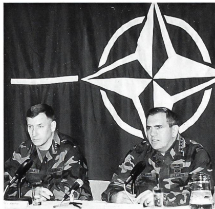
An der Pressekonferenz rechts General A Joulwan (SACEUR = Supreme Allied Commander Europe = Oberkommandierender der alliierten Streitkräfte in Europa) und links General John J Sheehan (SACLANT = Supreme Allied Commander Land = Oberkommandierender der Landstreitkräfte in Europa)

Das Telemark-Bataillon ist eine motorisierte Elite-Infanterie-Einheit der norwegischen Armee, welches zum erstenmal als Teil der AMF/L (Schnelle Eingreiftruppe der NATO innerhalb Europas) aufgenommen wurde. Das Telemark-Bataillon besteht aus 200 Offizieren und 700 Unteroffizieren und Soldaten. Der Standard dieser norwegischen Eliteeinheit ist sehr hoch, nach den regulären zwölf Monaten Militärausbildung absolvieren die Angehörigen weitere zwölf Monate. Als Transportmittel benützt das Telemark-Bataillon das Schützen-Panzerfahrzeug SISU sowie die HÄGGLUNDS BV 206.