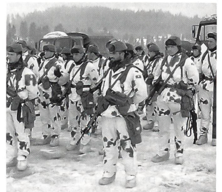
Der italienische Füsilierzug der Stabskompanie des 3. Alpini-Regimentes von Pinerolo bei Torino.