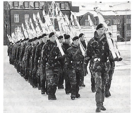
Niederländische Marineinfanteristen des 2. Marine-Bataillons bei der AMF(L)-Parade in Trondheim.