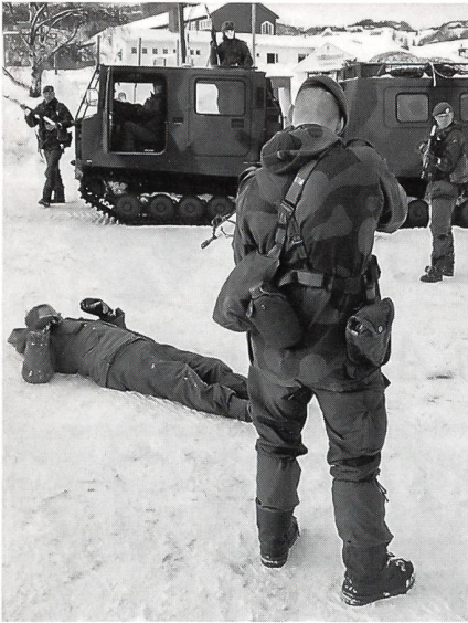
Ein Spährtrupp des norwegischen Telemark Bataillons hat beim Dorfeingang einen Eindringling gestellt. Das Transportfahrzeug HÄGGLUNDS BV 206 im Hintergrund.