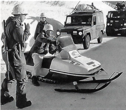
Anstelle eines Motorrads benützen hier die Melde-läufer einen LYNX SCOOTER.