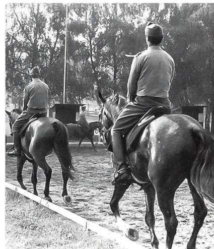
Train- und Veterinärasspiranten werden die Einrichtungen des NPZB auch in Zukunft für die Ausbildung benützen können.

Der Regierungsrat des Kantons Bern legt jetzt die Federführung für das Geschäft