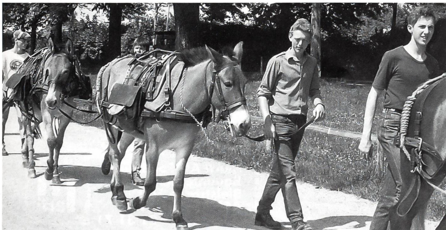
Der Leistungsauftrag des EMD umfasst auch die vor- und ausserdienstliche Ausbildung im Bereiche der Trainsoldaten. So werden die angehenden Trainsoldaten wie bisher ihren Vorkurs im NPZB absolvieren können.