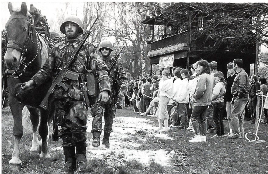
Das NPZB will sich dem Publikum noch vermehrt öffnen.

Als nächstes wird die Genossenschaft mit den zuständigen Bundesstellen die Übernahmemodalitäten über das Grundstück und die Anlagen abschliessend regeln müssen. Zur Sprache werden dabei auch die zu übernehmenden Pferde und das Material kommen. Insbesondere gehe es um die Klärung, was mit den zum Teil wertvollen und einzigartigen Kulturgütern wie Geschirre, Wagen usw. geschehen soll, erklärte der Verwaltungsratspräsident. Zudem würden mit der Bürgergemeinde Bern die Verhandlungen über den ihr gehörenden Springgarten weitergeführt. Ein wichtiger Punkt in den Gesprächen mit dem EMD, so Siegenthaler, würden die Personalfragen betreffen. Heute werden in der EMPFA – bei 90 Etatstellen – noch 76 Leute beschäftigt, eine Zahl, die von der neuen Trägerschaft nicht gehalten werden kann. Aufgrund der heutigen Leistungsaufträge kann mit einem durchschnittlichen Bestand von 155 Pferden gerechnet werden (70 bis 80 Militärpferde, 30 Remonten, 25 Ausbildungsplätze für private Züchter und Ausbildner sowie 20 Pferde für das Reitergymnasium). So rechnet man – bei