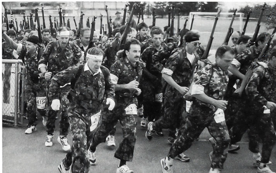
Das berühmte, enge Starttor am Zürcher Waffenlauf 1995.