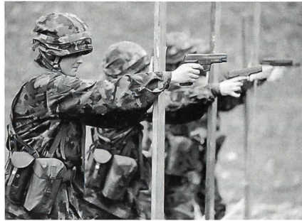
Vorrücken, zielen und schiessen – neben der täglichen Arbeit mit dem Pferd erhalten die Frauen auch die Ausbildung im Umgang mit der Pistole.

tion, die durch die Armee 95 entstanden ist, ausgenutzt und liessen sich zum Train einteilen, zu einer Waffengattung, die eine Arbeit mit dem Pferd zulässt, die aber physisch an eine Frau (gelegentlich auch an Männer) hohe Anforderungen stellt. Ihre Wahl fiel auf den Train, und dies musste wohl überlegt sein. Bereits beim Trainkurs, der vor der Rekrutenschule von jedem angehenden Trainsoldat absolviert werden muss, hatten die vier Frauen Gelegenheit, einen Blick in die Trainwelt zu werfen und mit der Realität im Rahmen der Arbeit mit dem Pferd konfrontiert zu werden. Dass das Leben des Trainsoldaten nicht immer nur die sonnigen Seiten im Beisein des Pferdes bedeutet, konnten sie während den ersten vier Wochen ihrer Grundausbildung merken. Doch die Zusammenarbeit mit dem Pferd, die dürfte reichlich vorhanden sein bei einem Bestand von 140 Pferden und Maultie-