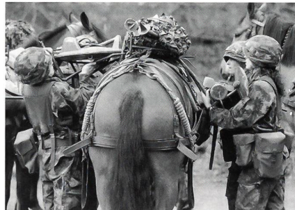
Das Beladen der Pferde erfordert von Männern und Frauen gelegentlich grosse Anstrengungen.