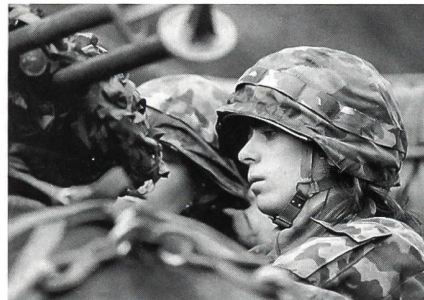
Das ungewohnte Bild: Eine Frau beim Train.