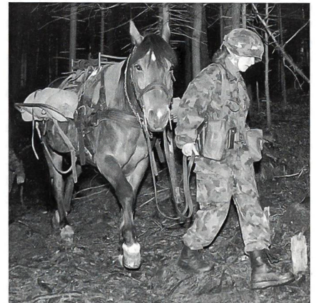
Das Führen des Pferdes erfordert keine Kraft, sondern viel Gefühl und ein gutes Verhältnis zum Tier.