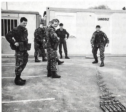
Der Einsatz des Nagelbretts muss geübt sein!