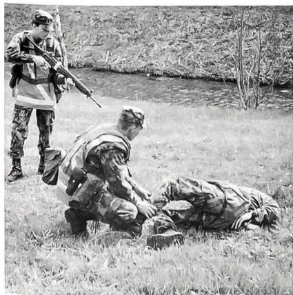
Durchsuchen einer verdächtigen Person.

Als Hauptproblem nebst dem fehlenden Material stellte sich in den ersten Ter Füs-Klassen das dem einsatzbezogenen Bedrohungsbild angepasste Verhalten. Für einen Ter Füs ist der Schusswaffengebrauch nur in den selten-