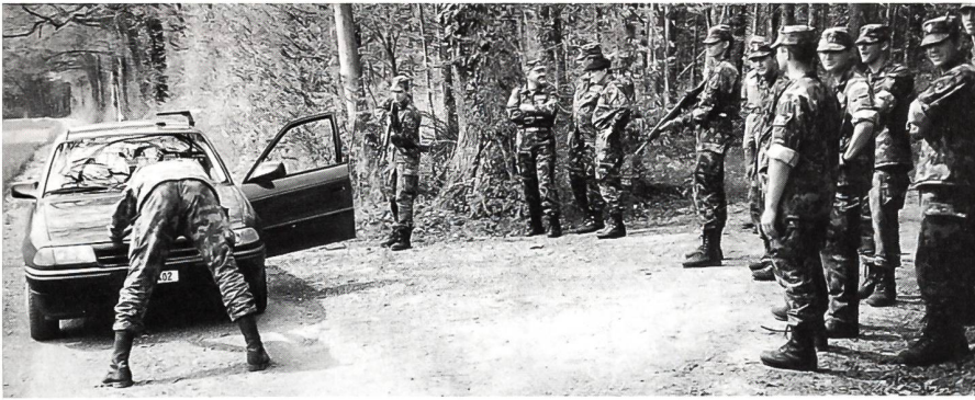
Überprüfung eines Fahrzeuges und einer verdächtigen Person.

zisten! Er muss geistig gewandt, kompetent und fit sein.»