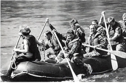
122 Wettkämpferinnen und Wettkämpfer sowie 26 Funktionäre widmeten den Auffahrtstag der ausserdienstlichen Tätigkeit.