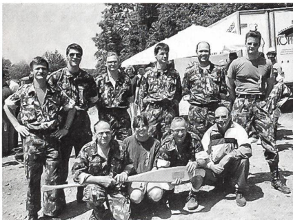
Der UOV Nidwalden, die siegreiche Bootsmannschaft der Reusstalfahrt 1995

Das Ziel der Reusstalfahrt befand sich beim Lorzenspitz. Hier herrschte bald ein emsiges Treiben. Die Boote wurden an Land gezogen und zusammengepackt, immer unter dem wachsamen Auge der Froschmänner und -frauen der Lebensrettergesellschaft Luzern. Dann waren auch hier drei Wettkampfdisziplinen zu absolvieren, nämlich Luftpistole- und Luftgewehrschiessen, Kameradenhilfe (Versorgen einer Schürfwunde oder einer arteriellen Blutung) sowie Fahrzeugkontrolle. Auch für das leiblich-