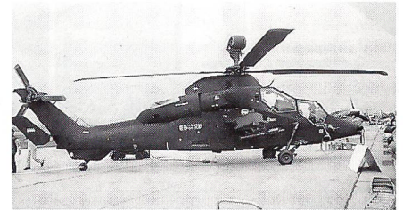
Premiere vor Publikum: Prototyp des Kampfhelikopters Eurocopter Tiger

fighter 2000 zeigte sich der Öffentlichkeit erstmals im Flug. Das von Deutschland, Grossbritannien, Spanien und Italien gemeinsam in Entwicklung stehende und politisch umstrittene Projekt wird noch dieses Jahr Schlagzeilen machen, wenn die Parlamente über den Serienbau befinden müssen. In Berlin wurde der deutsche Prototyp DA1 gezeigt, der im März 1994 seinen Erstflug unternommen hatte und bis heute rund 50 Stunden geflogen ist.