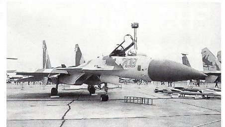
Mehrzweck-Kampfflugzeug Sukhoi Su-35

Auf dem militärischen Sektor stachen als Neuheiten der Eurofighter 2000, der Kampfhelikopter Tiger von Eurocopter sowie der mittlere Transport- und Mehrzweckhelikopter NH 90 hervor, der von einem europäischen Konsortium entwickelt wird. Der Euro-