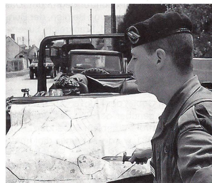
Der Kommandant der französischen Aufklärungskompanie zeigt sein mögliches Einsatzgebiet.