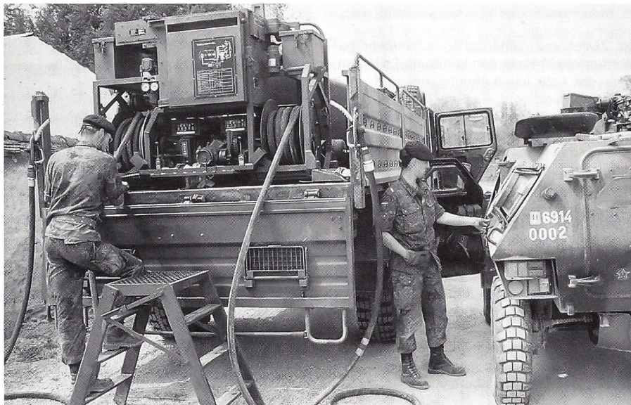
Der deutsche Obergefreite Eckert an einem 5T GLTA (Geländetankaufsatz) beim Auftanken eines französischen VBL (Vehicule Blindé Léger).

Bei strömendem Regen zeigten die Soldaten der 5. Kompanie des deutschen Jägerbataillons 292 einen Angriff mit anschliessendem Gefecht und Häuserkampf, bei welchem die Photoausrüstung des Schreibenden arg strapaziert wurde. Zum Glück hielt eine Kamera bis zum Schluss durch, bevor die Wassermassen des strömenden Regens zu stark wurden und es schlussendlich einen Kurzschluss in der Elektronik der Kamera gab.