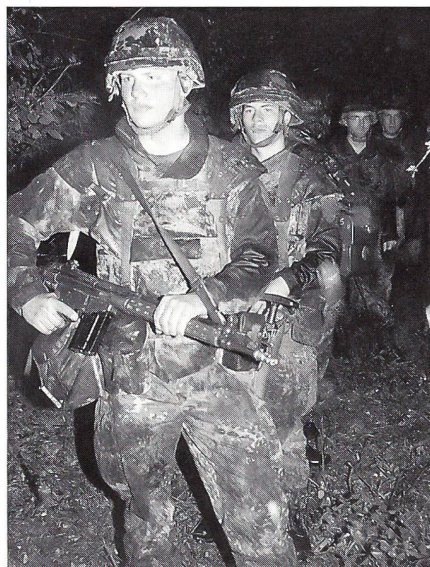
Nass bis auf die Knochen wartet der Stosstrupp des Jägerbataillons 292 auf den Angriff (die Jäger sind mit Schusswesten ausgerüstet).