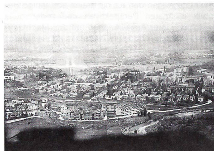
Eindrücklicher Endanflug: Zerstörte Gebäude, wo hin man blickt.

Je tiefer sich die Fokker dem Boden nähert, desto sichtbarer werden die zerstörten Häuser und Dörfer. Direkt in der Anflugschneise liegen Ruinen der einst so blühenden Stadt Sarajevo. «Da schau, es brennen wieder ein paar Lichter der Anflugbefeuerung