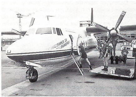
Die für die OSZE fliegende Fokker F-27 von Farner Air Transport beim Auslad in Sarajevo.

gungen erfüllt und die guten Erfahrungen aus früheren Operationen seien ausschlaggebend gewesen, begründet Adrian Baumgartner die Wahl von Farner Air Transport.