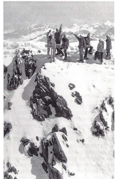
Auf dem Gipfel vom Finsteraarhorn (4273,9 Meter über Meer), am Sonntag, den 27. August 1995

Neben der Vorbereitung von normalen Operationen unter alpinen Verhältnissen lag eine eindeutige militärische Notwendigkeit zur Er-