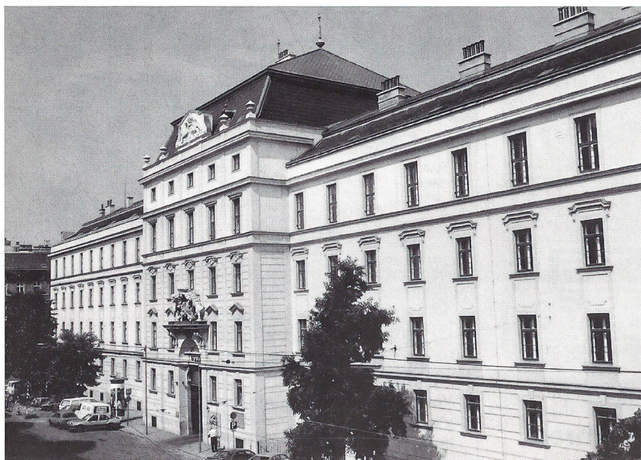
Hauptgebäude der österreichischen Landesverteidigungsakademie.

Faustus Furrer: Österreich mit seinen geistigen, künstlerischen und gestalterischen Leistungen hat uns Schweizern viel zu bieten. Der regelmässige Schulbetrieb der Akademie ermöglichte es mir und meiner Familie, das reichhaltige kulturelle Angebot geplant und ausgiebig zu erleben. Verschiedene Musicals sprachen bereits unsere schulpflichtigen