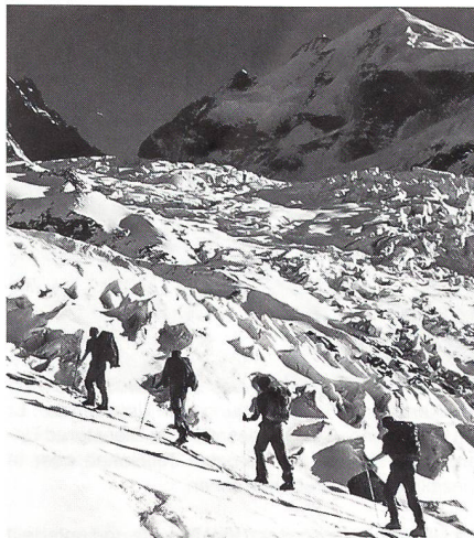
Die Gebirgskurse führen oft in hochalpines Gelände. Ein Detachement steigt zur Tschiervahütte auf. Im Hintergrund der Piz Roseg.

Vom Sonntag, 3. März, bis Donnerstag, 7. März 1996 , wird der Wintergebirgskurs mit Basis in Interlaken durchgeführt werden. Das Schwergewicht der Ausbildung wird auf Skitouren mit dazugehörendem Umfeld liegen. Die Sicherheit im winterlichen Gebirge wird stark von der Erfahrung und den Kenntnissen jedes einzelnen beeinflusst. Diesen Faktoren tragen die Kursziele Rechnung, stehen doch neben wunderschönen Skitouren für Anfänger und Fortgeschrittene auch intensive Ausbildung in Routenwahl, Lawinenkenntnissen sowie Rettungs- und Sanitätsdienst auf dem Programm. Wen hat es während dem Skifahren nicht schon gereizt, die gewaltigen Pisten zu verlassen, um einen unberührten Schneegipfel in der Nachbarschaft zu suchen, hat dies aber aus berechtigtem Respekt vor Lawinen unterlassen? Diese 5 Tage sind eine ausgezeichnete Gelegenheit, kostenlos und besoldet unter kundiger Anleitung und in einer kameradschaftlichen Atmosphäre erste Erfahrungen im Gelände ausserhalb der Pisten zu machen. Speziell in den Anfänger-Detachementen wird das Tiefschneefahren gründlich instruiert.